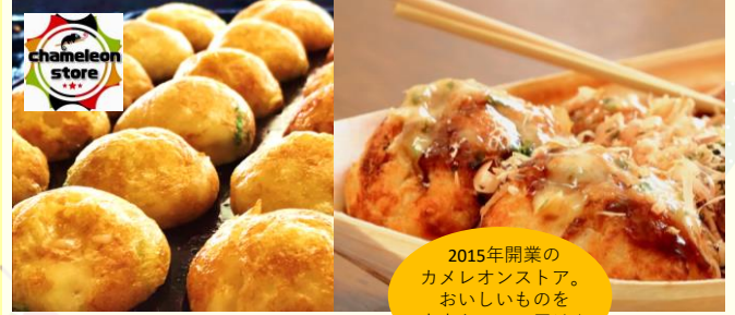
たこ焼き～大阪仕込み～