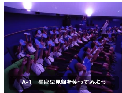
A-1 星座早見盤を使ってみよう