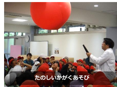
たのしいかがくあそび

※上記のテーマのほか、《磁石》《振動》《静電気》《真空》などの実験も可能です。(静電気は季節限定) ※時間は上記を基準に30～60分でご相談のうえ決定いたします。閑散期には、科学実験教室や科学工作にも対応します。